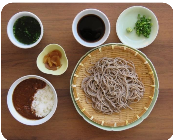
カレー井(冷)セット