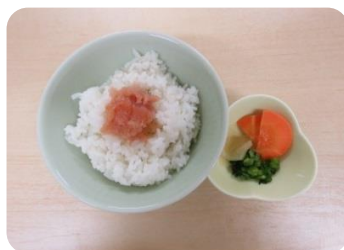
宝満明太子ご飯 220円(税込)