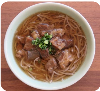
牛肉トッピング 280円(税込)