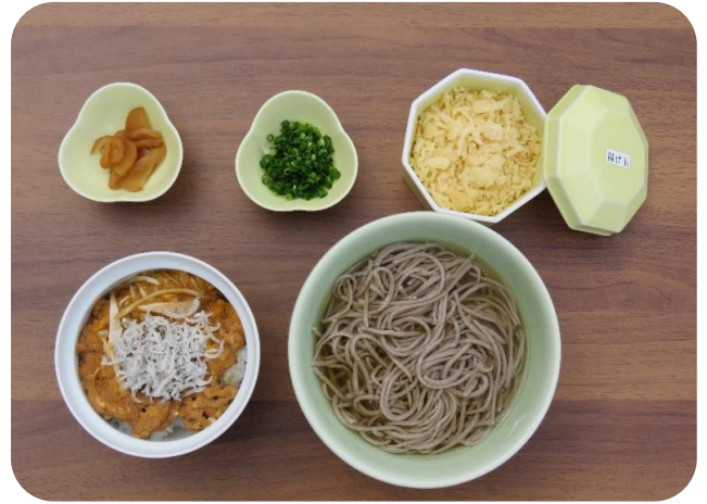
しらす井(温)セット