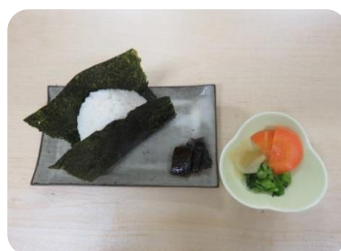
おにぎり(白) 150円(税込)