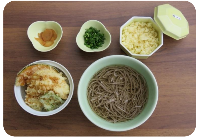
穴子天井かけ(温)そばセット 1,650円(税込)