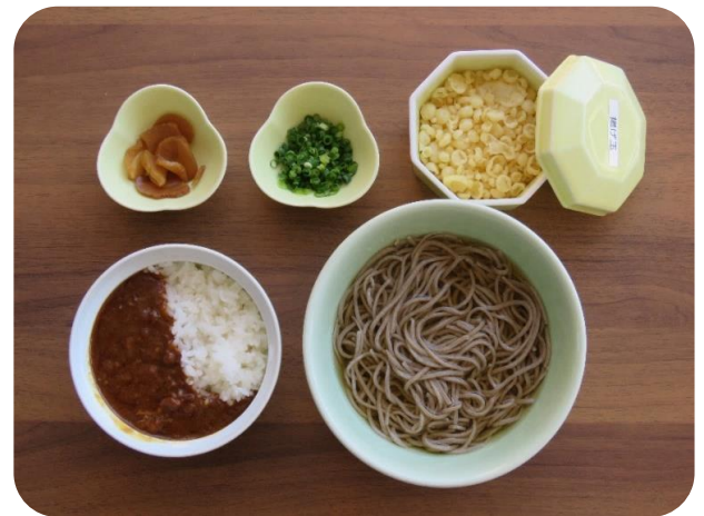
カレー井(温)セット