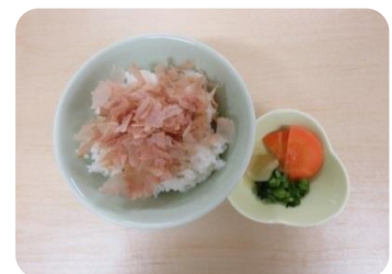
本枯かつお節ご飯 220円(税込)