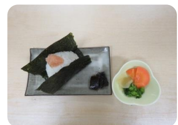
おにぎり(明太子) 220円(税込)