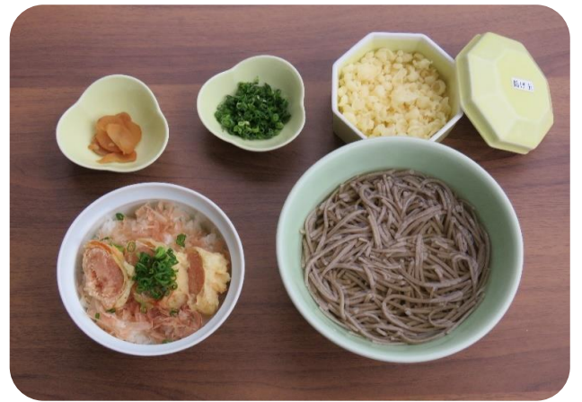
明太天井かけ(温)そばセット 1,430円(税込)