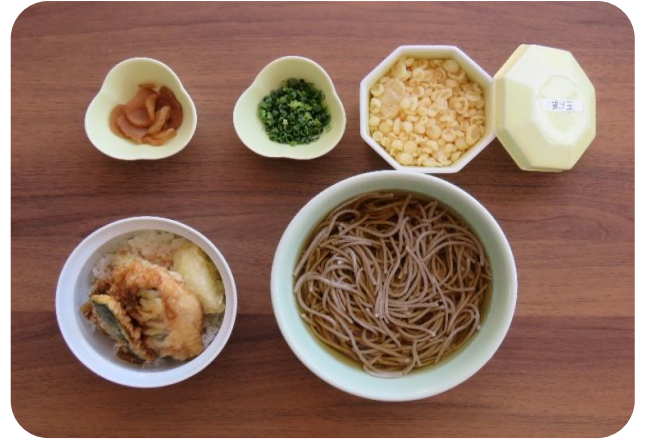
季節の魚の天井かけ(温)そばセット 1,540円(税込)