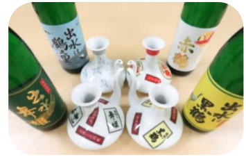
※各銘柄 水割り・お湯割り・ロック 300円(税込)