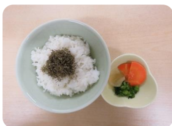
富山黒とろろご飯 220円(税込)