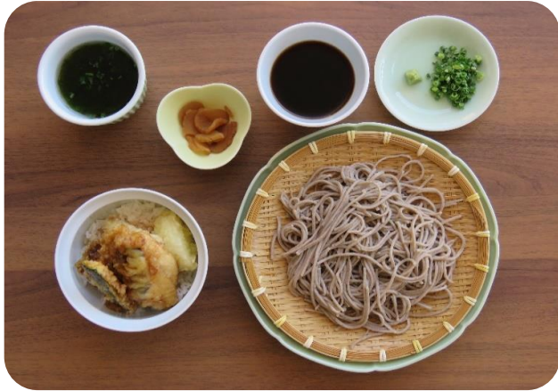
季節の魚の天井ざる(冷)そばセット 1,430円(税込)