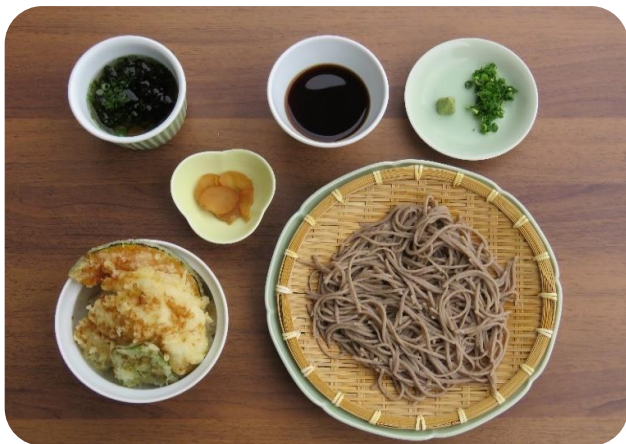
穴子天井ざる(冷)そばセット 1,540円(税込)