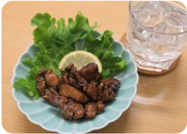
南国元気鶏の炭火焼き 220円(税込)