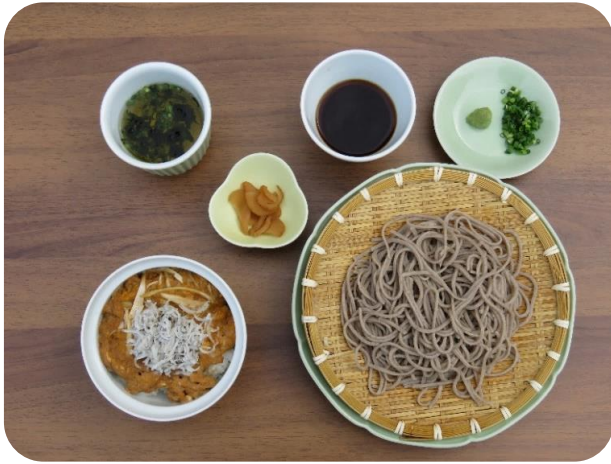
しらす井(冷)セット