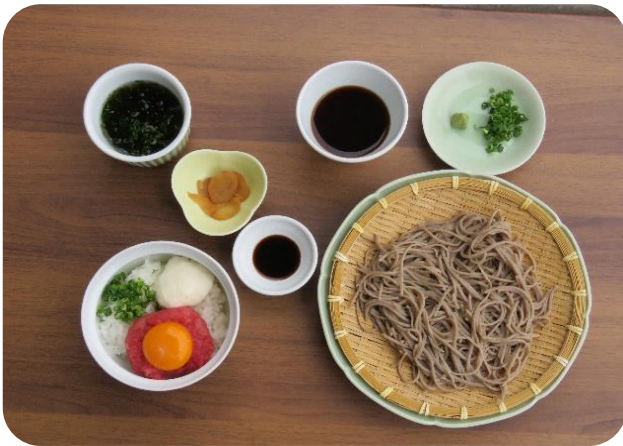
まぐろ井(冷)セット

※しらす井にはエビ・カニが含まれている場合がございます。アレルギーをお持ちの方はご注意ください。