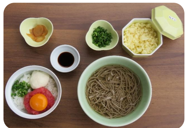
まぐろ井(温)セット