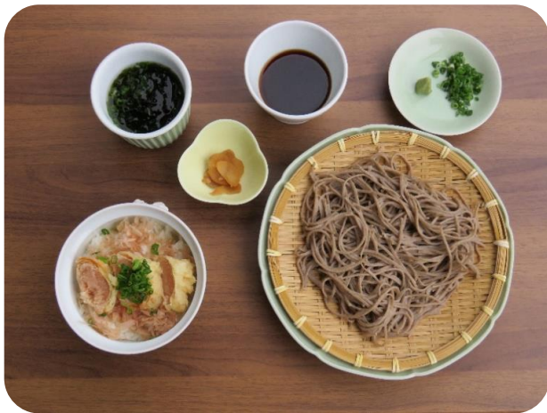
明太天井ざる(冷)そばセット 1,320円(税込)