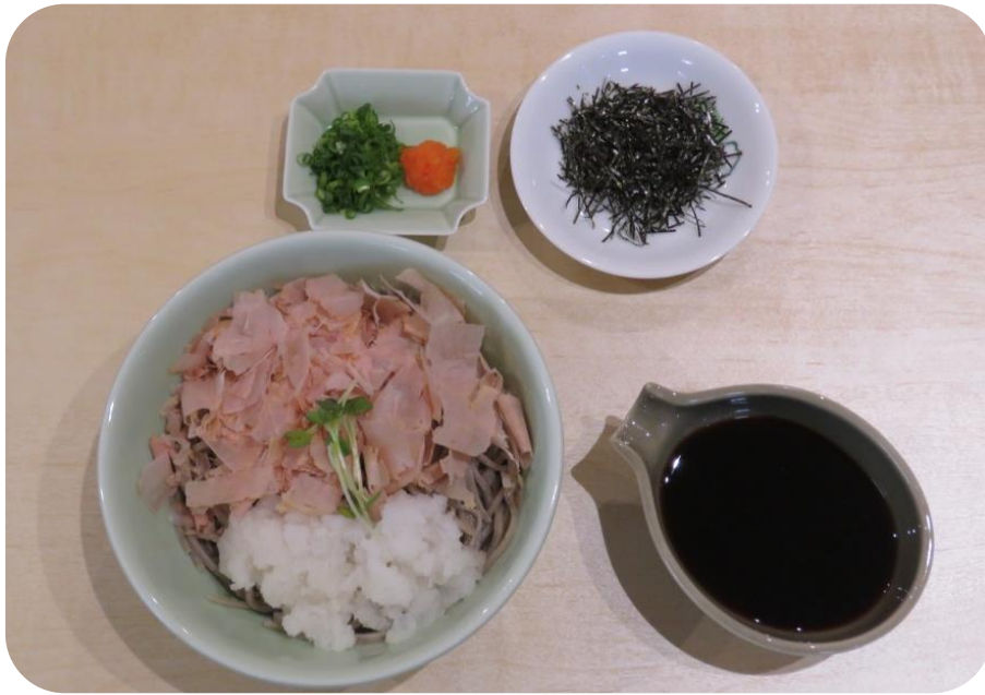
おろしそば 880円(税込)